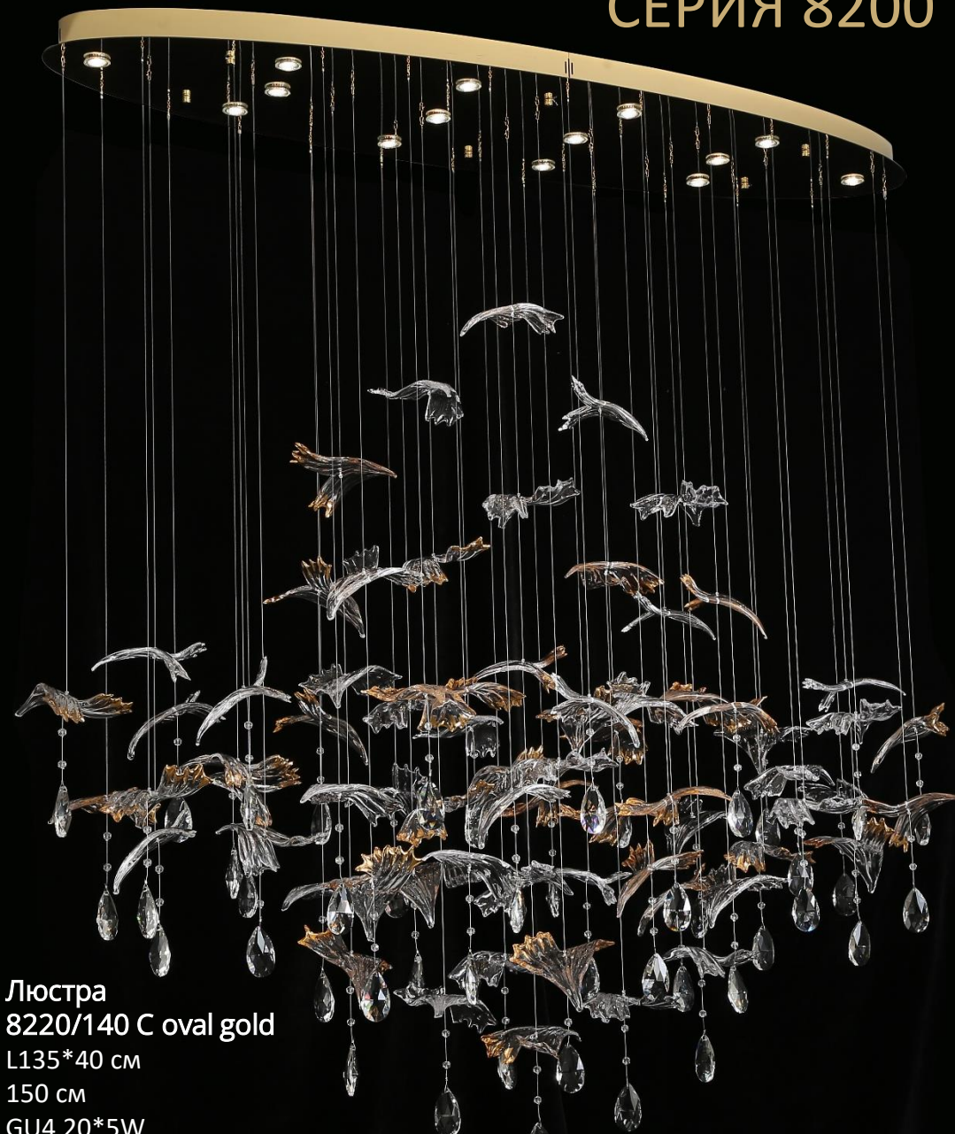
Люстра 8220/140 C oval gold L135*40 см 150 см GU4 20*5W